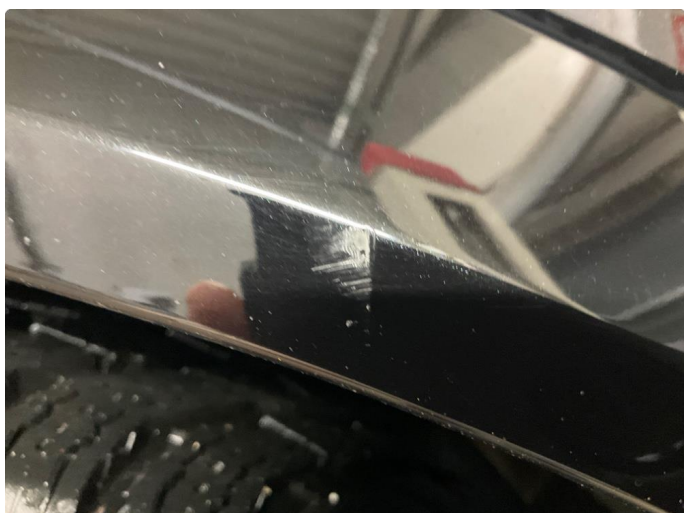
1.2 Riper (Repareres)