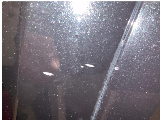
1.2 Riper (Repareres)