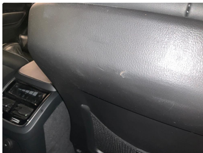
2.1 Skade på seterygg (Repareres)