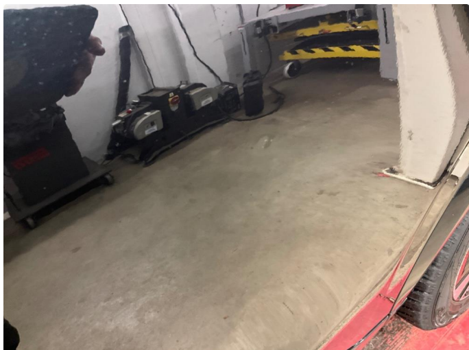
1.1 Bulk (Repareres)