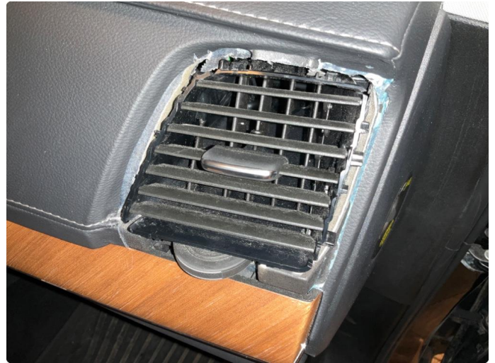
3.1 Øvrige feil (Reparert)