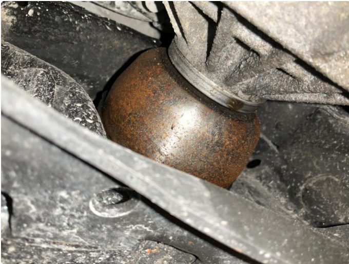
2.1 Lekkasje (Reparert)