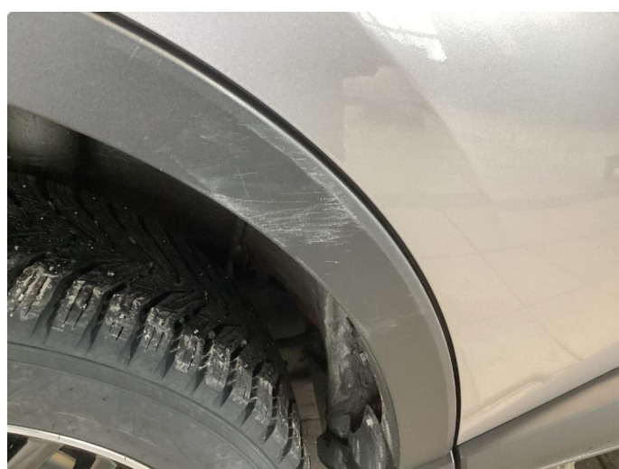
1.5 Skjermutbygger skadet