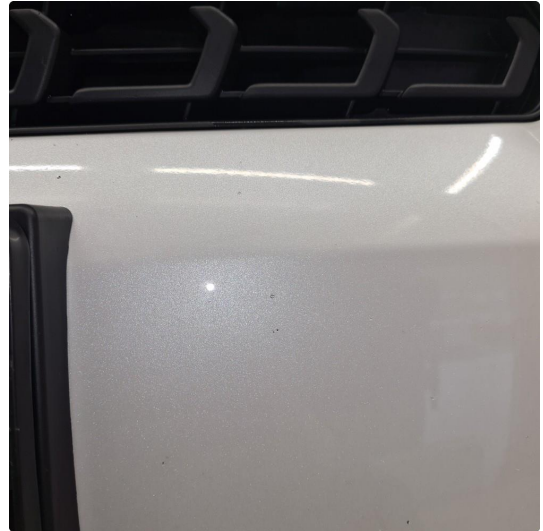
1.1 Noen steinsprang og riper i lakk