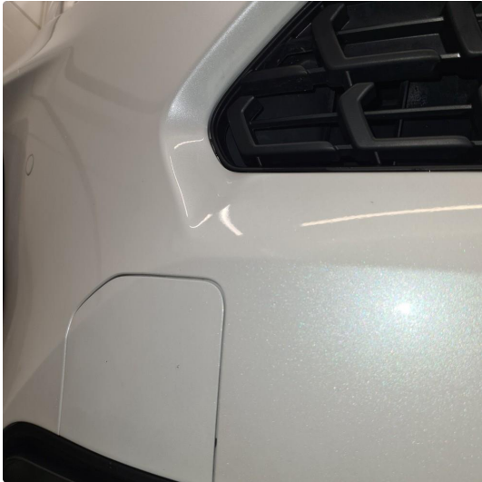
1.1 Noen steinsprang og riper i lakk