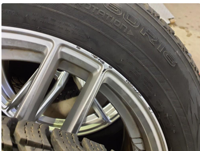
1.1 Kantkjørt felg