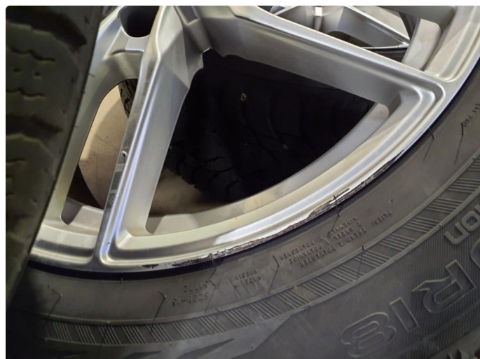
1.1 Kantkjørt felg