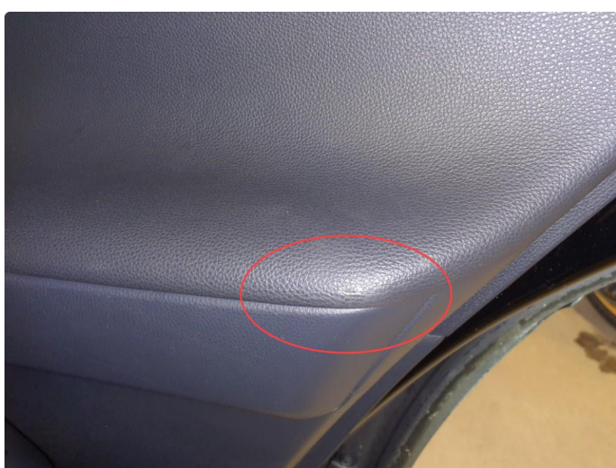
2.1 Liten rift