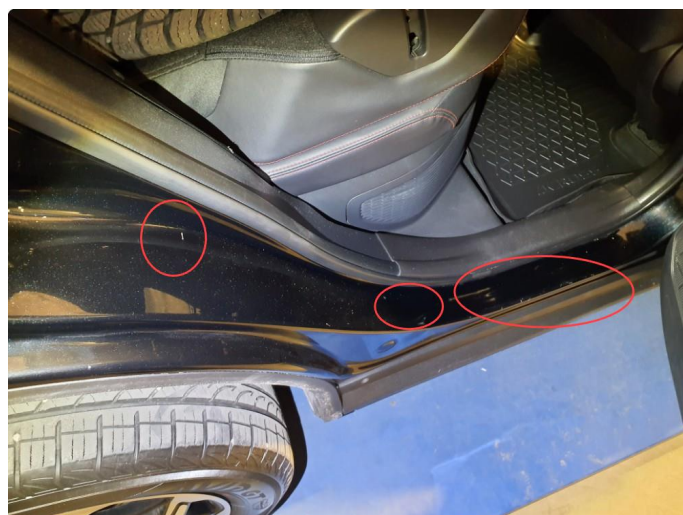
1.4 Bulk med lakkskade