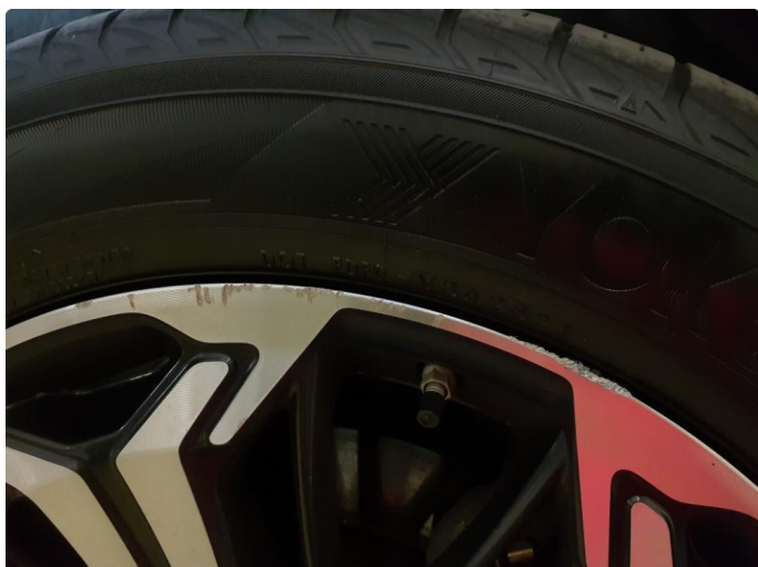
1.1 Kantkjørt felg Diamond Cut