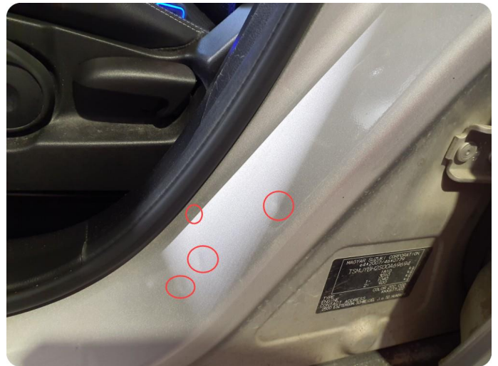
2.2 Bulk(er) med lakkskade