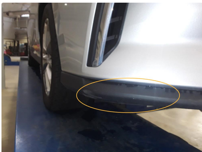
1.3 Skrubbskader underkant