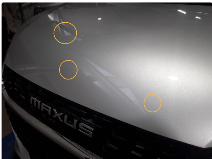
1.1 Noe steinsprut som er utbedret å pensel lakkert