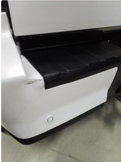
1.1 Liten skade