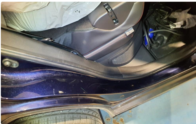
1.3 Noen riper og småbulker