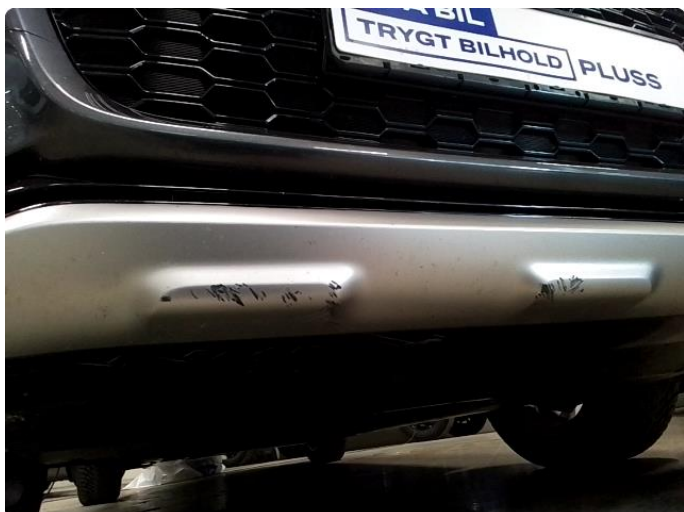
1.1 Riper plastikk under front.