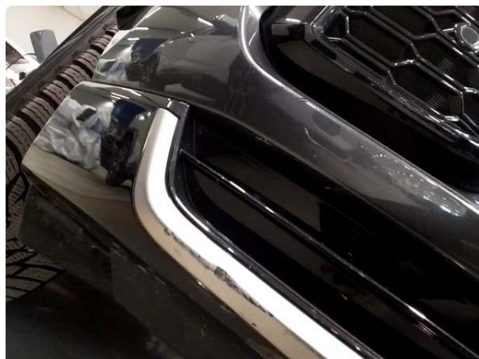
1.1 Riper plastikk under front.