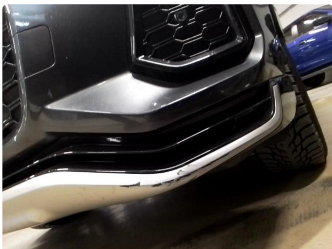
1.1 Riper plastikk under front.