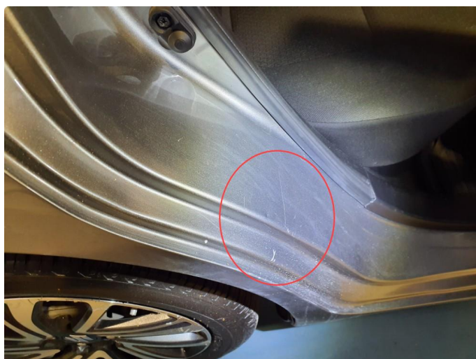
1.3 Bulk(er) med lakkskade