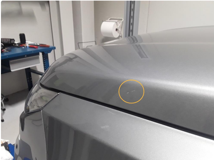
1.1 Noe steinsprut på panser