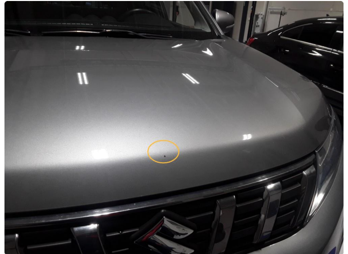
1.1 Noe steinsprut på panser