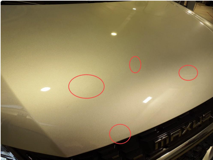
1.1 Noe steinsprut som er utbedret og er pensel lakkert