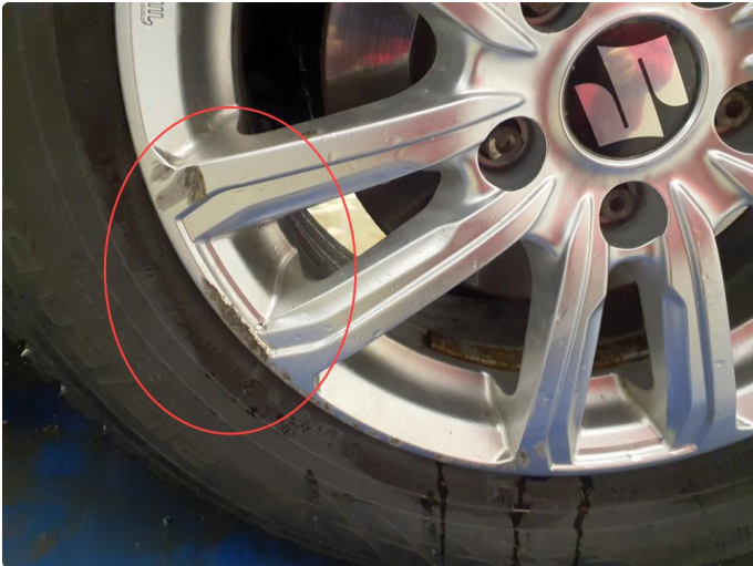
1.1 Litt kantkjørt felg