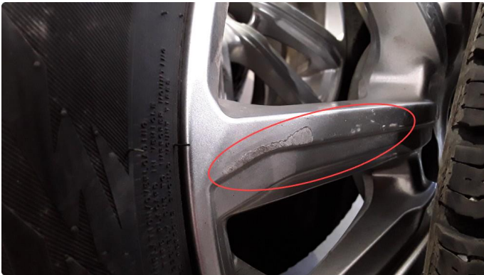
1.1 Ripe (r) gjennom lakk