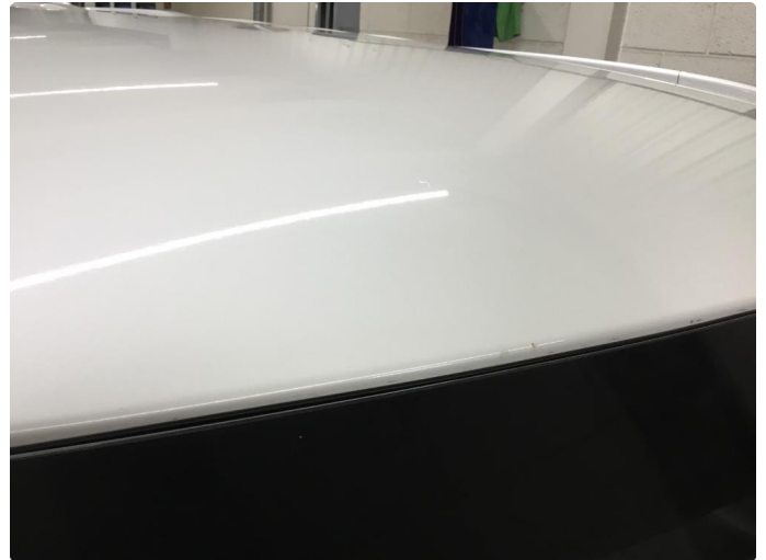
1.1 Noe steinsprut/hakk i lakken/Normal bruksslitasje.