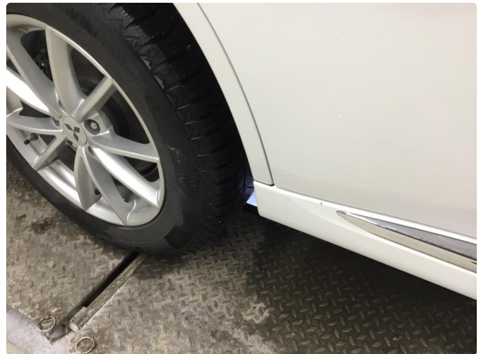
1.1 Noe steinsprut/hakk i lakken/Normal bruksslitasje.