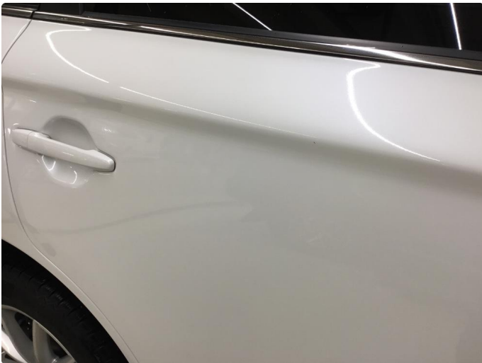
1.1 Noe steinsprut/hakk i lakken/Normal bruksslitasje.