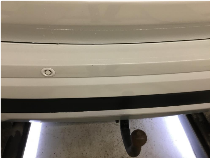
1.1 Noe steinsprut/hakk i lakken/Normal bruksslitasje.