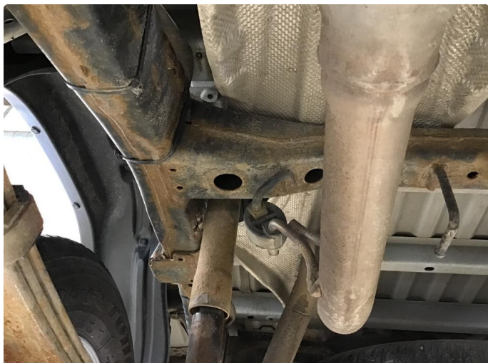
1.1 Bil er ikke understellsbehandlet - Anbefaler en understellsbehandling