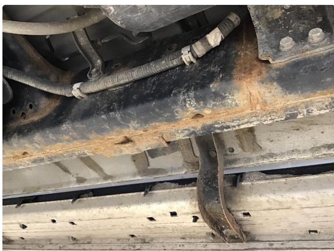
1.1 Bil er ikke understellsbehandlet - Anbefaler en understellsbehandling