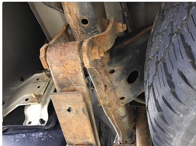
1.1 Bil er ikke understellsbehandlet - Anbefaler en understellsbehandling