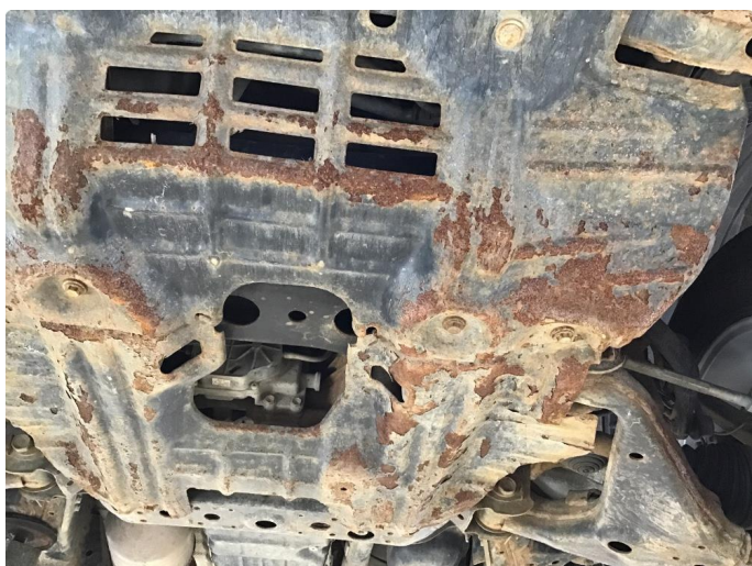
1.1 Bil er ikke understellsbehandlet - Anbefaler en understellsbehandling