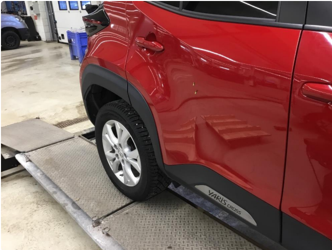
1.1 2 p-bulker høyre bakdør. PDR.