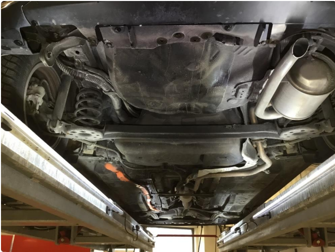
2.1 Bilen er understellsbehandlet.