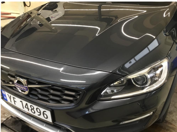
1.1 Noe steinsprut/riper/hakk/normal bruksslitasje rundt bilen.