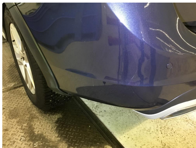
1.1 Noe steinsprut/riper/hakk/normal bruksslitasje rundt bilen.