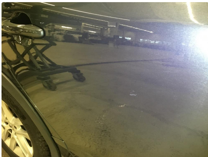
1.1 Noe steinsprut/riper/hakk/normal bruksslitasje rundt bilen.