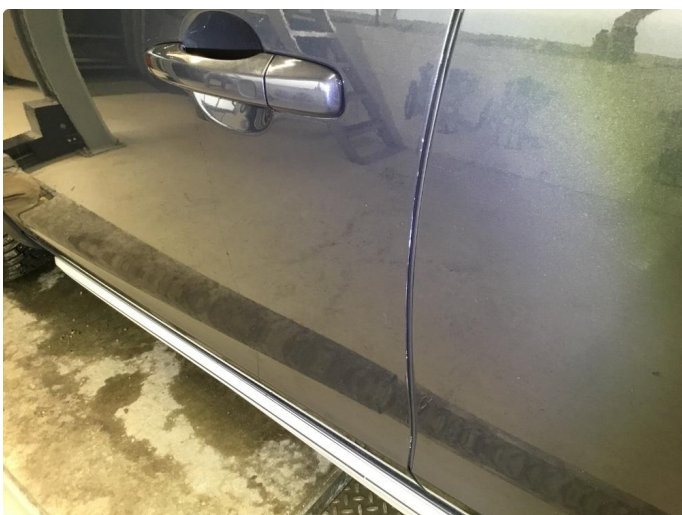
1.1 Noe steinsprut/riper/hakk/normal bruksslitasje rundt bilen.