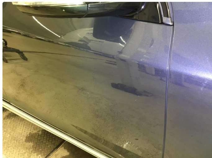
1.1 Noe steinsprut/riper/hakk/normal bruksslitasje rundt bilen.