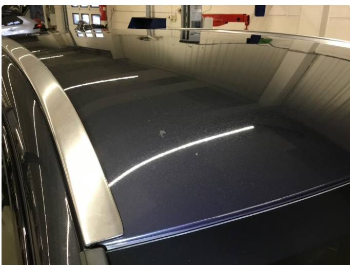
1.1 Noe steinsprut/riper/hakk/normal bruksslitasje rundt bilen.