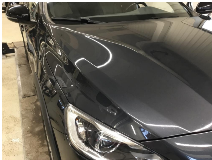
1.1 Noe steinsprut/riper/hakk/normal bruksslitasje rundt bilen.