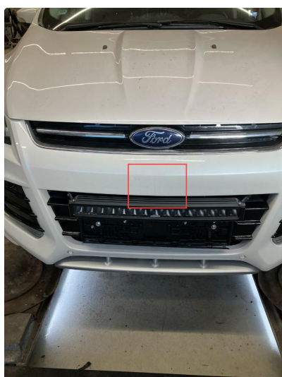
1.3 Sprekk i fanger foran på midten over skilt. (Fanger er omlakkert tidligere)