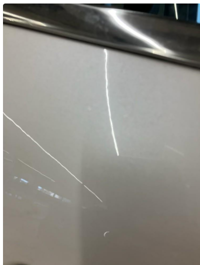
1.1 Noe deler på bilen omlakkert, noe støv i lakken h.fordør bl annet.