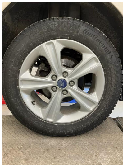
1.2 Noe irr/korrosjon vinterfelger.