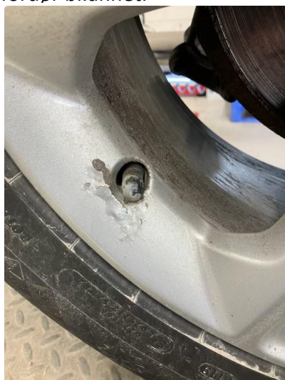
1.2 Noe irr/korrosjon vinterfelger.