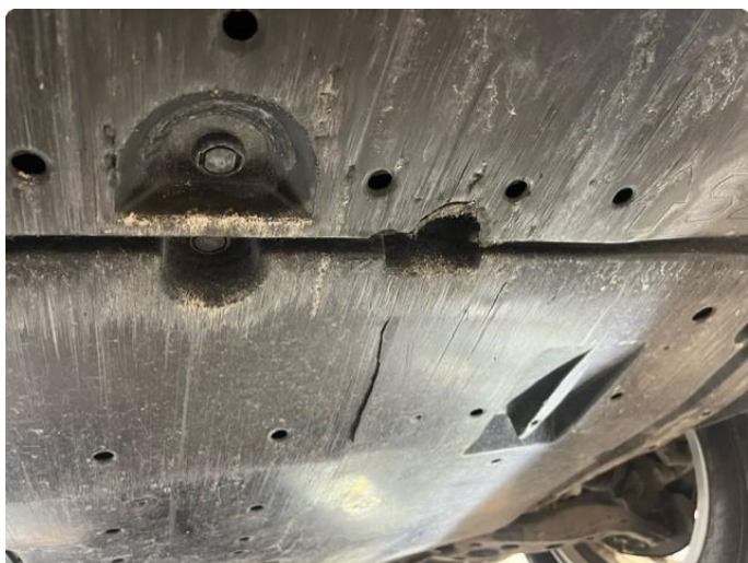
1.1 Beskyttelsesplate skadet/mangler