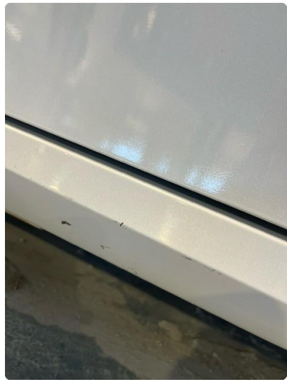
1.6 Ripe(r) ned til grunning