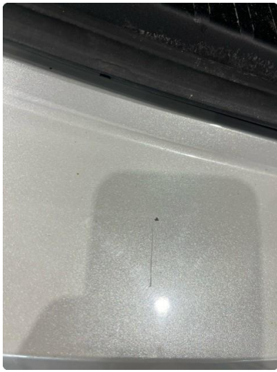
1.5 Ripe(r) ned til grunning