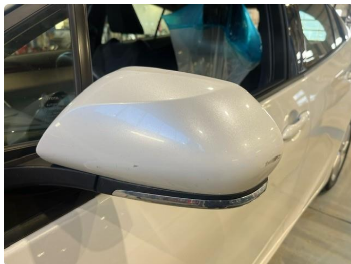
1.2 Deksel skadet/ripe