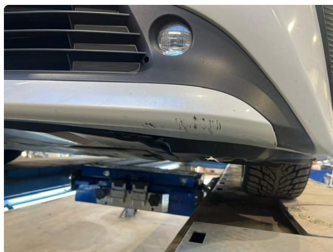
1.4 Skrubbskader underkant