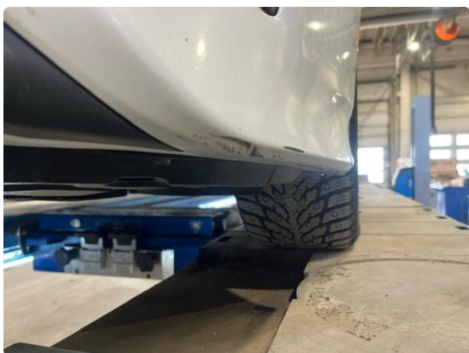
1.4 Skrubbskader underkant