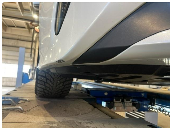
1.4 Skrubbskader underkant