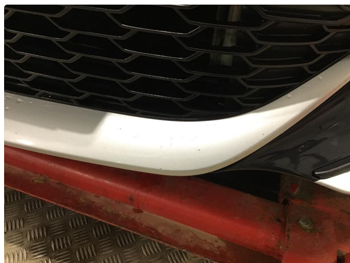
1.1 Noen steinsprang og riper i lakken