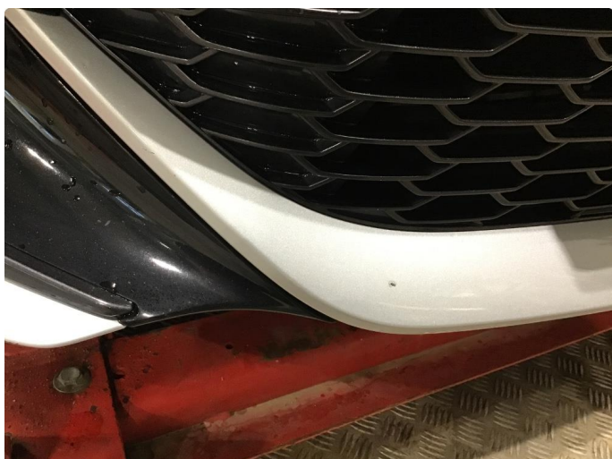
1.1 Noen steinsprang og riper i lakken