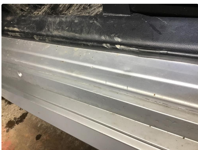
1.2 Noen riper i innsteg