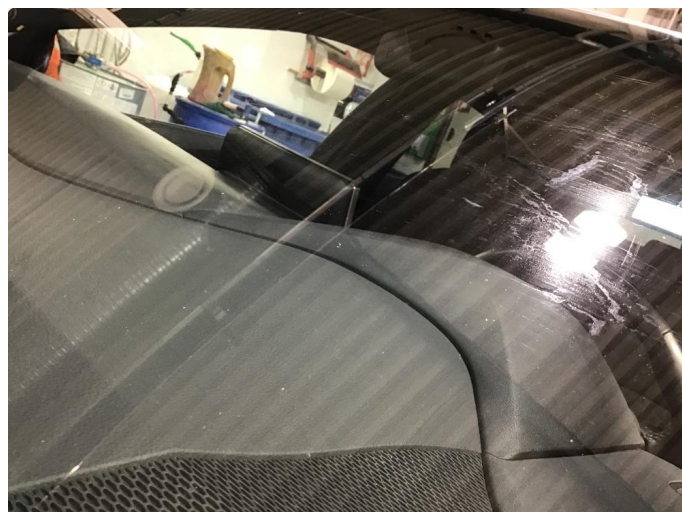
1.1 Noen steinsprang og riper i lakken