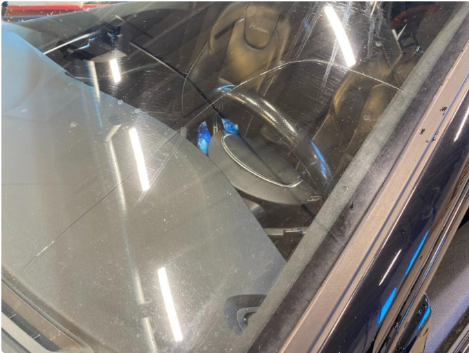
1.4 Frontrute skiftes før salg