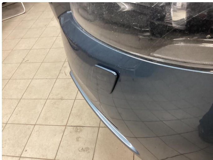
1.7 Lyktespyler deksel mangler