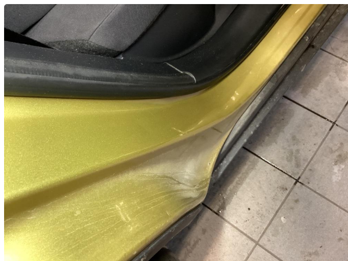
1.1 Noen riper og småbulker