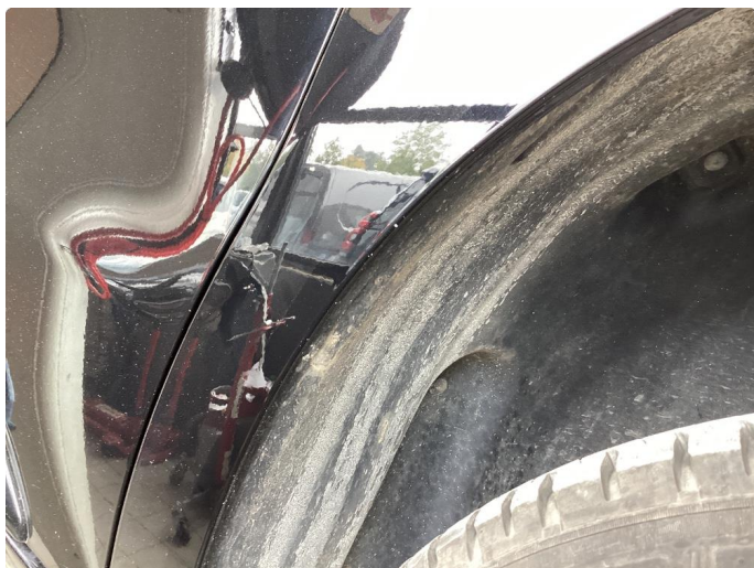
1.3 Noe steinsprut