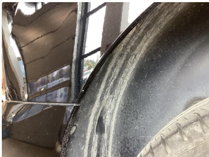
1.3 Noe steinsprut