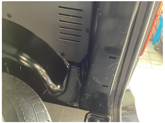
2.1 Riper døråpning