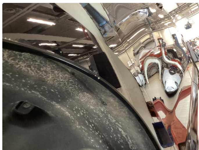
1.3 Noe steinsprut