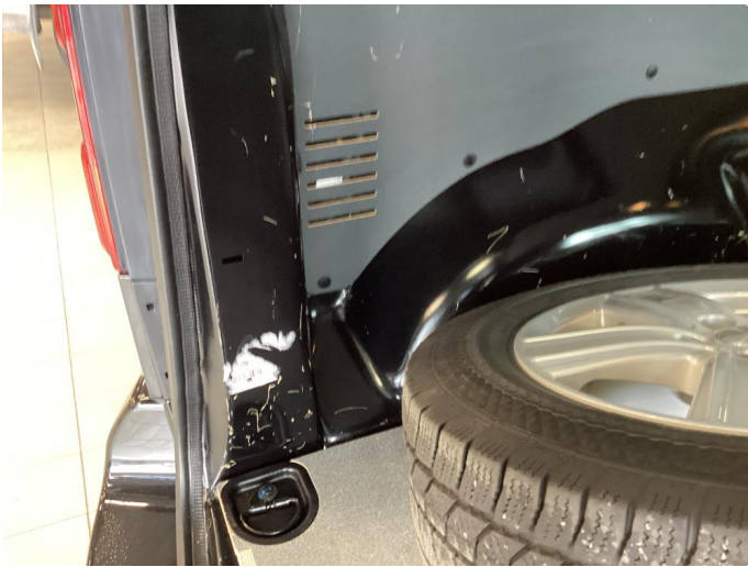
2.1 Riper døråpning