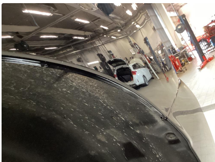
1.3 Noe steinsprut