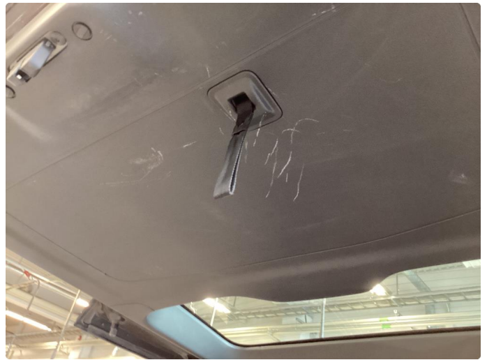
2.1 Riper døråpning