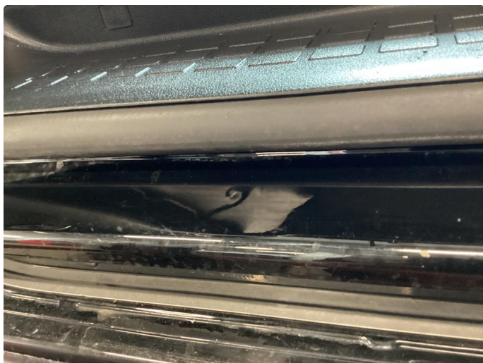
1.5 Bulk med lakkskade