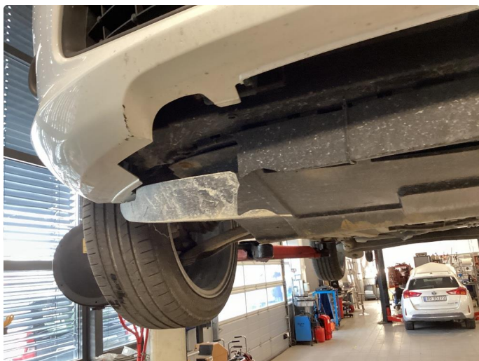
1.7 Spoilerlist defekt