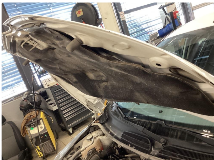
1.2 Støymatte/deksel løst