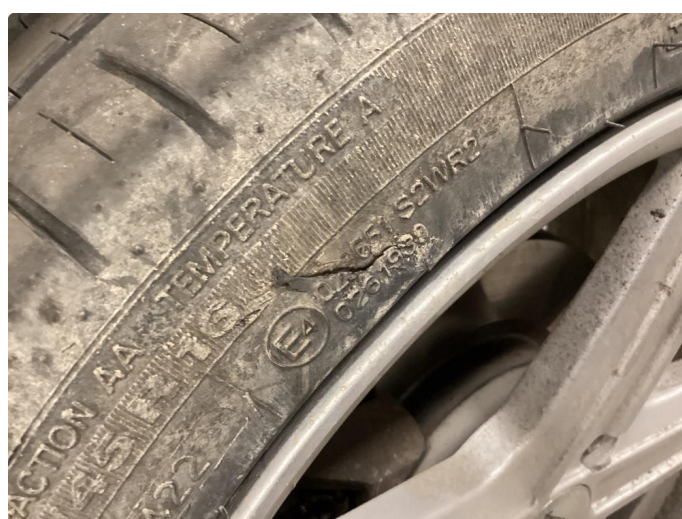
1.6 Dekkskade sommerhjul