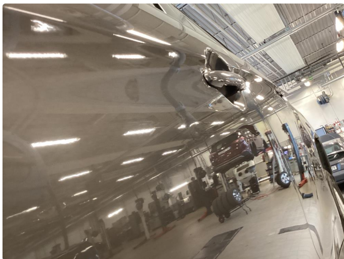
1.5 Flere p-bulker