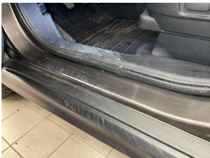
1.9 Slitt gjennom lakk