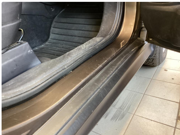
1.11 Noen riper og småbulker