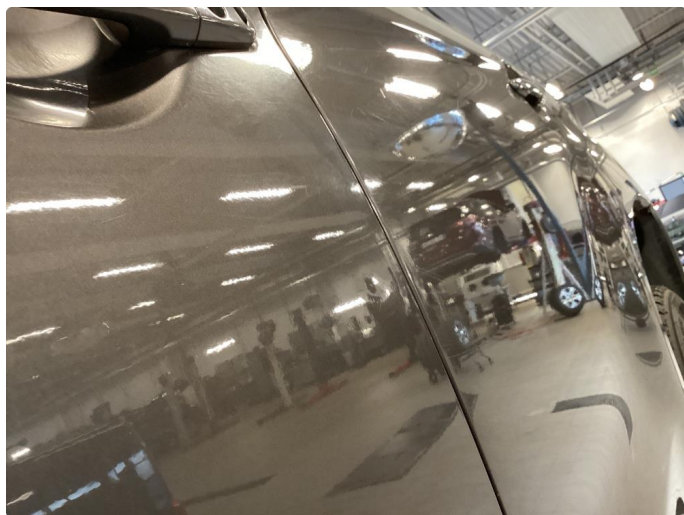
1.5 Flere p-bulker