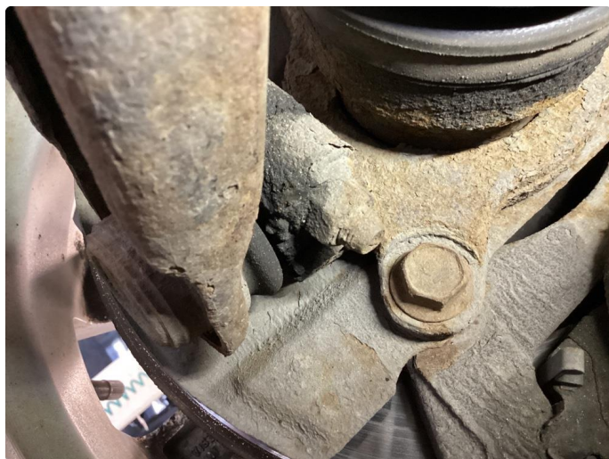
3.1 Mansjett bærekule defekt