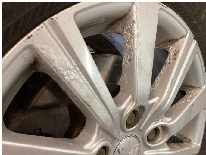
1.8 Betydelig oksidering