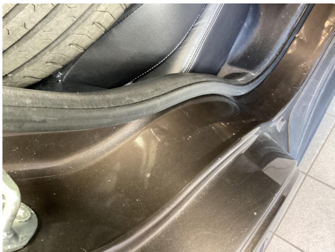
1.11 Noen riper og småbulker