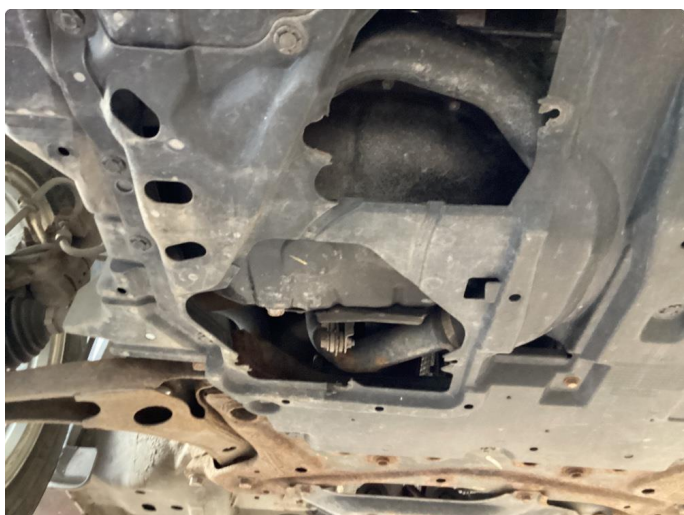
1.2 Beskyttelsesplate skadet/mangler