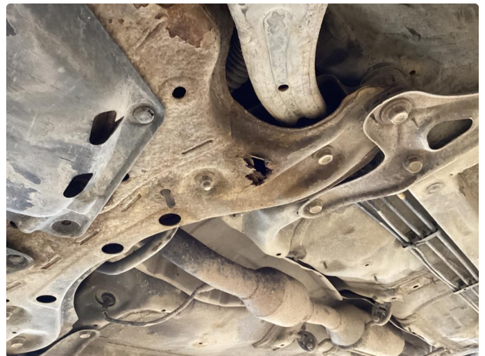
4.2 Øvrige feil