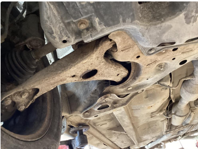
4.2 Øvrige feil