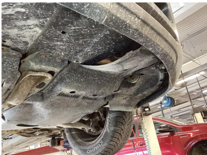
1.1 Beskyttelsesplate skadet/mangler