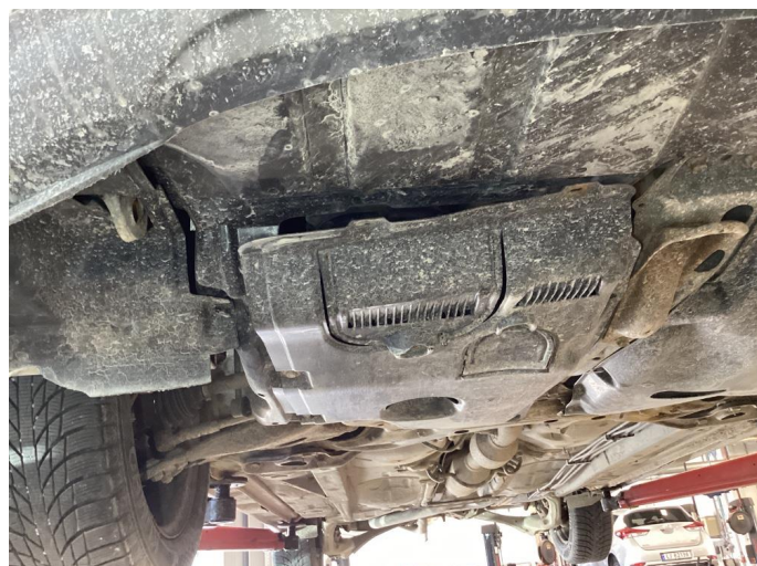
1.1 Beskyttelsesplate skadet/mangler