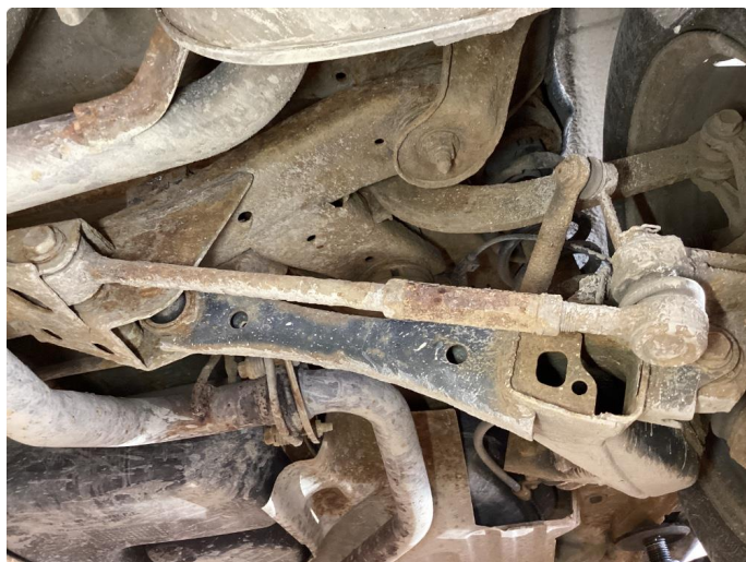
4.3 Øvrige feil