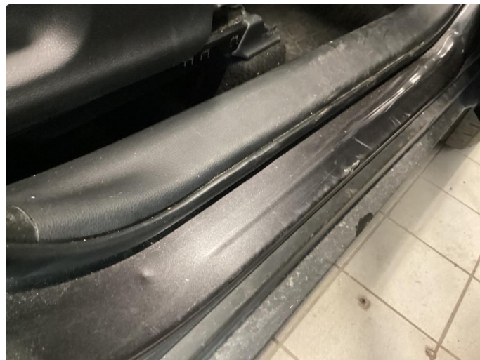
1.2 Noen riper og småbulker