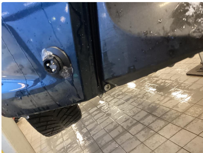
2.8 Ufagmessig utført arbeid