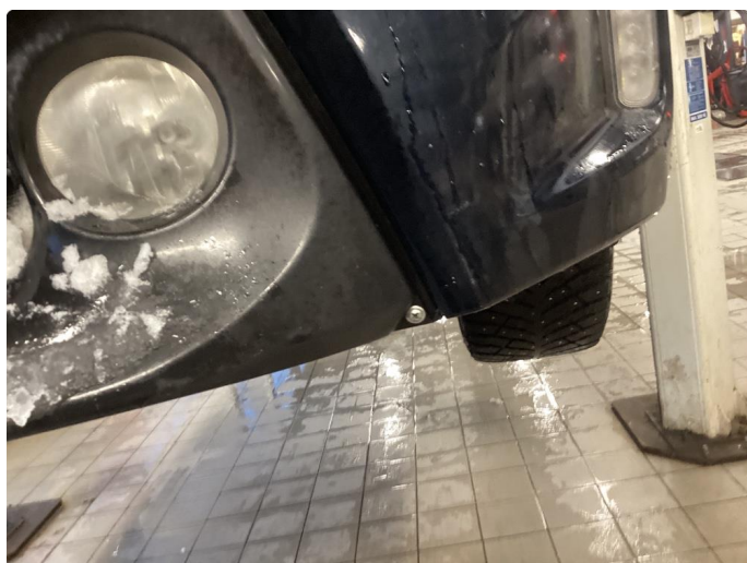
2.8 Ufagmessig utført arbeid