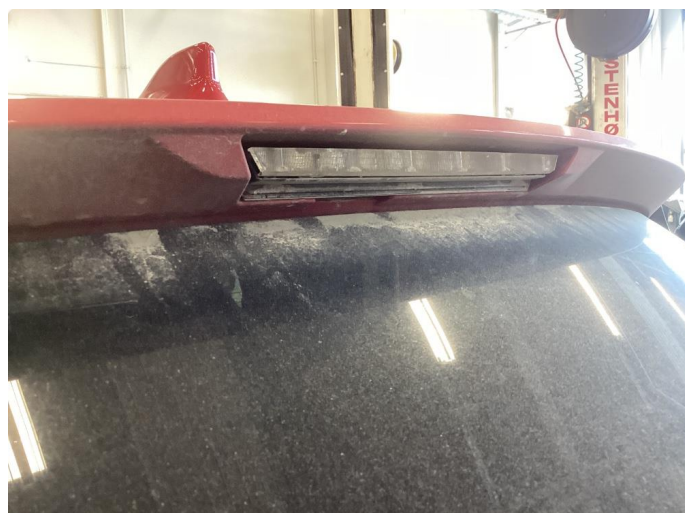
1.2 Defekt / sprukket glass