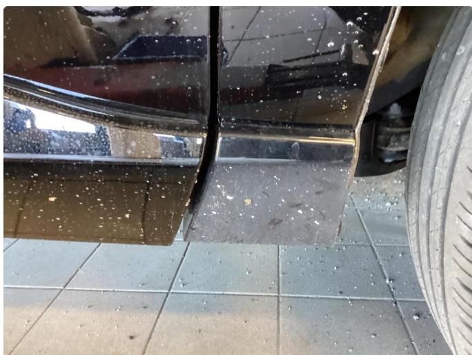
1.3 Matt/slitt lakk