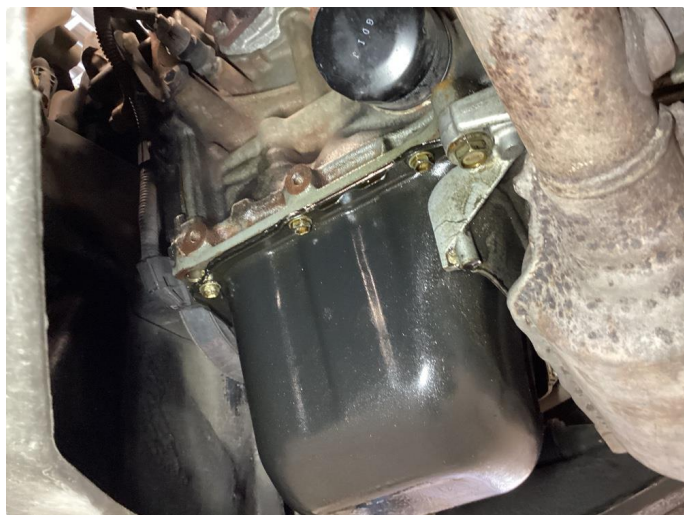
2.2 Oljelekkasje fra motor