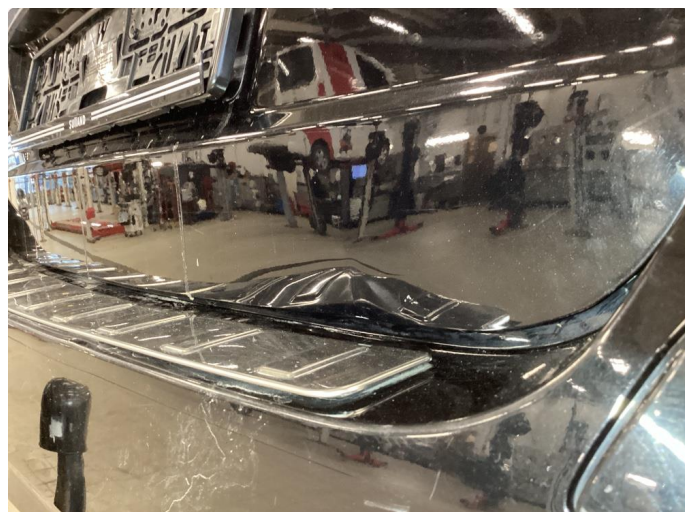
2.2 Bulk med lakkskade