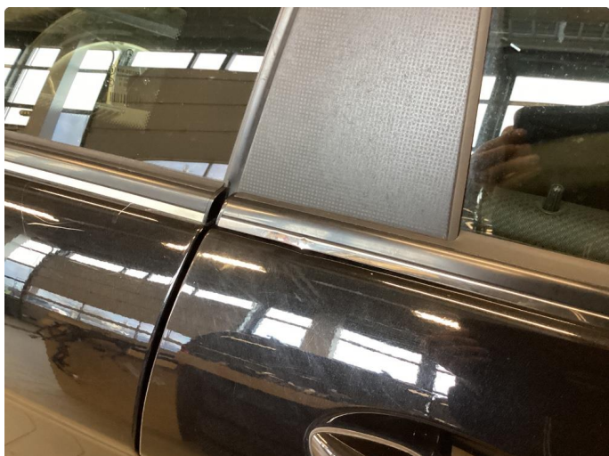
2.1 Løse/skadede lister