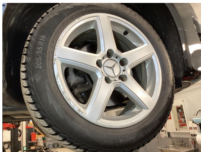
2.4 Kantkjørt felg