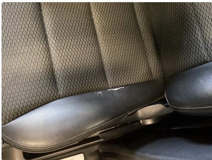
6.1 Skade på setetrekk