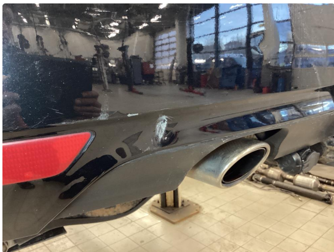
2.7 Bulk med lakkskade