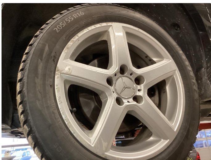
2.4 Kantkjørt felg