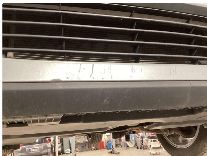
1.5 Skrubbskader underkant