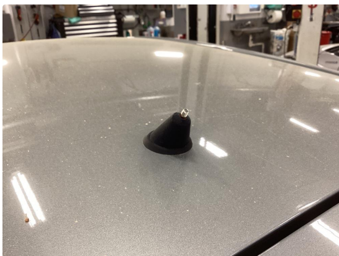
1.6 Øvrige feil