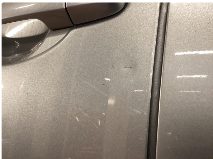
1.1 Generelt mye riper og småbulker