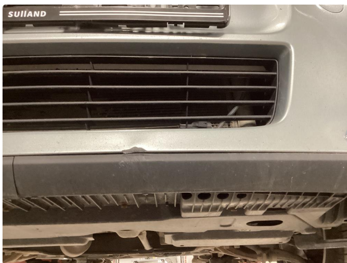
1.5 Skrubbskader underkant