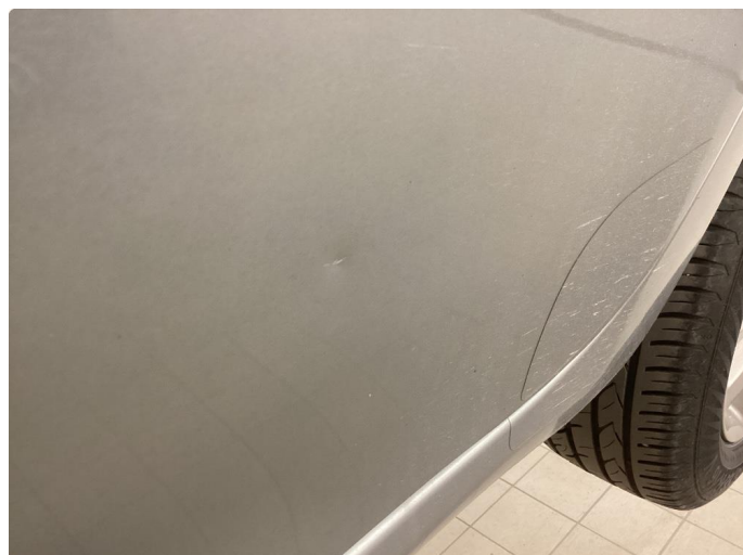
1.1 Generelt mye riper og småbulker