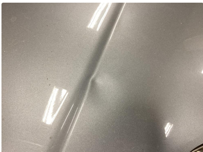
1.2 Bulk med lakkskade