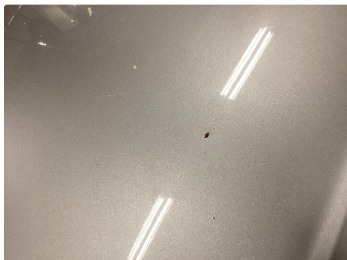
1.2 Bulk med lakkskade