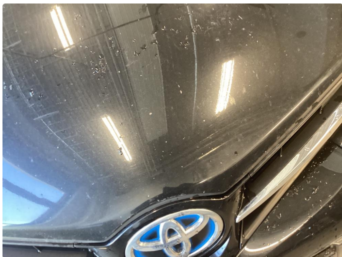
1.2 Noe steinsprut med rust