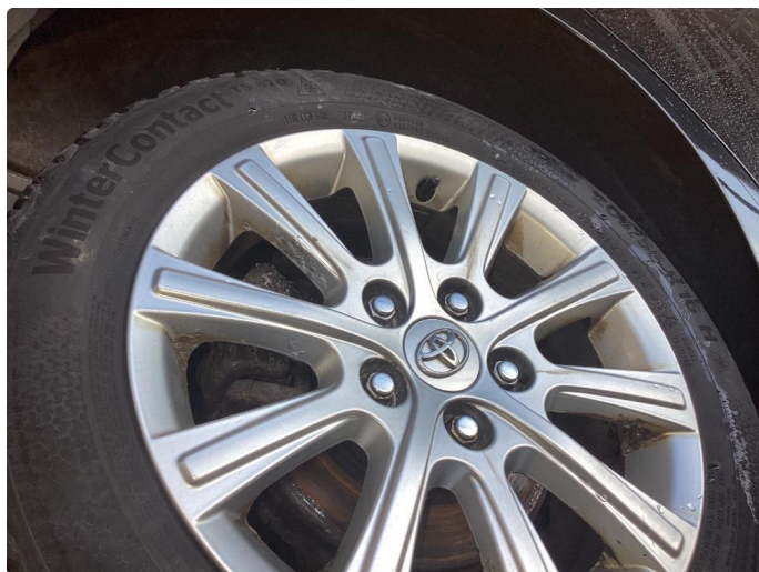
1.6 Betydelig oksidering