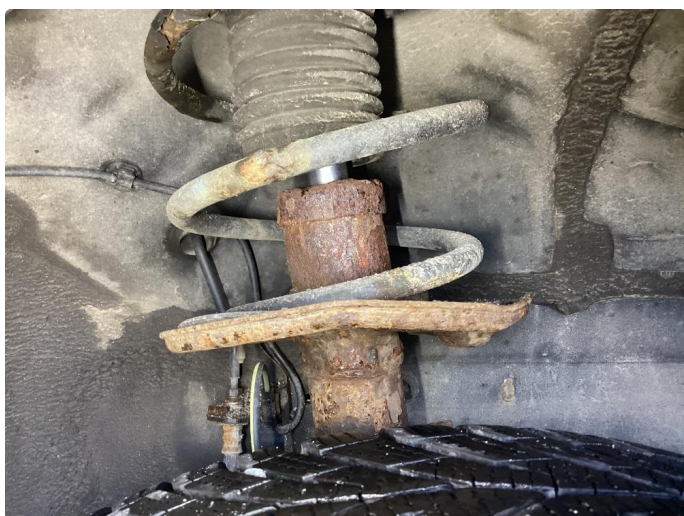
3.1 Rust i nedre fjærbenfeste