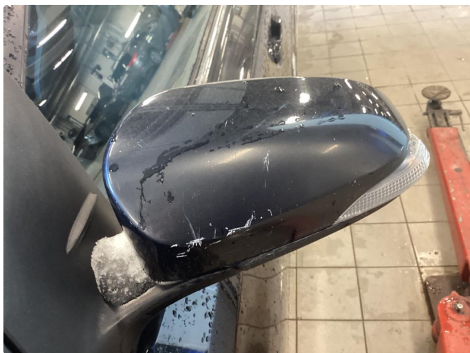
1.5 Speilhus riper