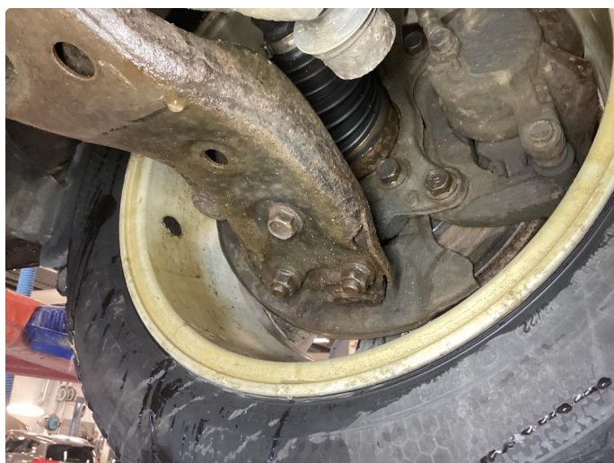
1.6 Betydelig oksidering