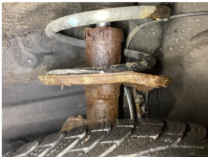
3.1 Rust i nedre fjærbenfeste