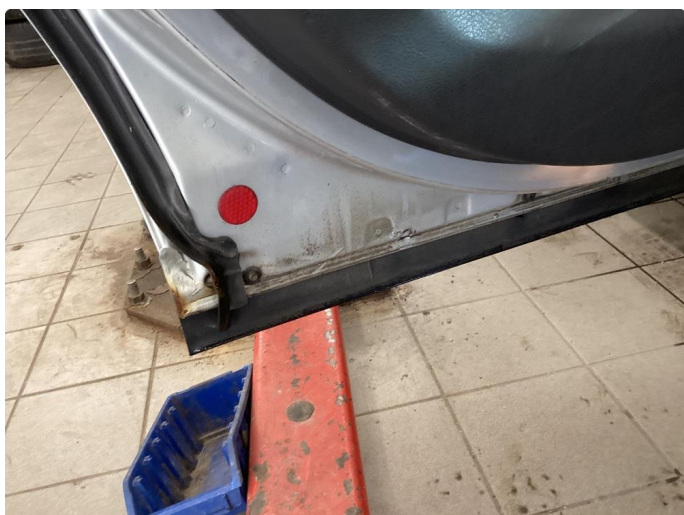
1.3 Rust i fals