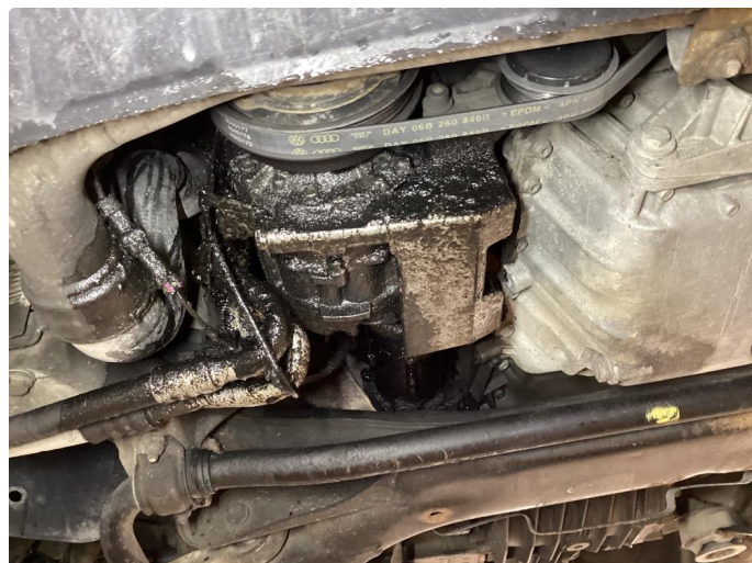
3.4 Oljelekkasje i forkant