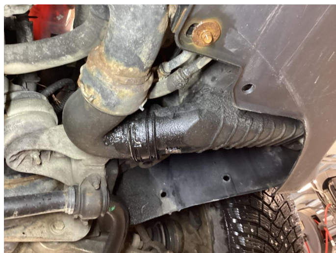
3.4 Oljelekkasje i forkant