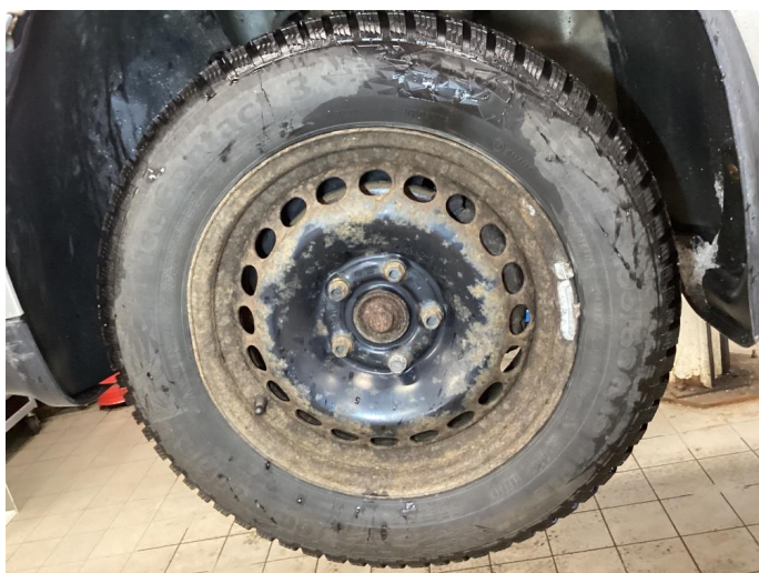
1.8 Hjul kapsel mangler