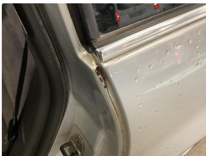
1.3 Rust i fals