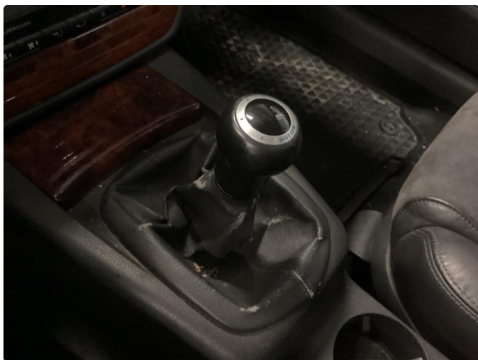
7.1 Girmansjett slitt/defekt