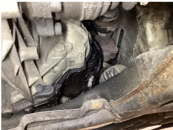
3.4 Oljelekkasje i forkant