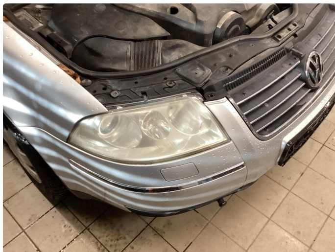
2.1 Matte glass