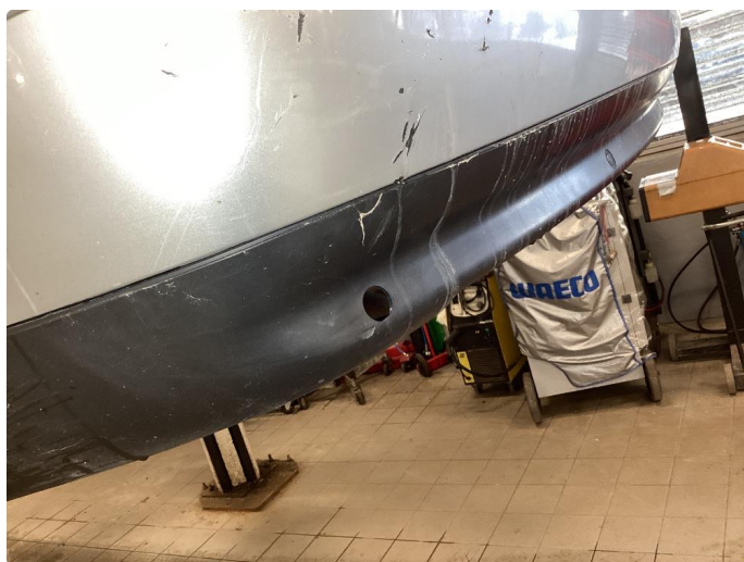
1.11 Øvrige feil