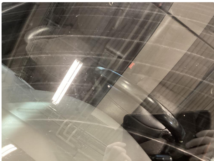
1.14 Steinsprut i synsfelt