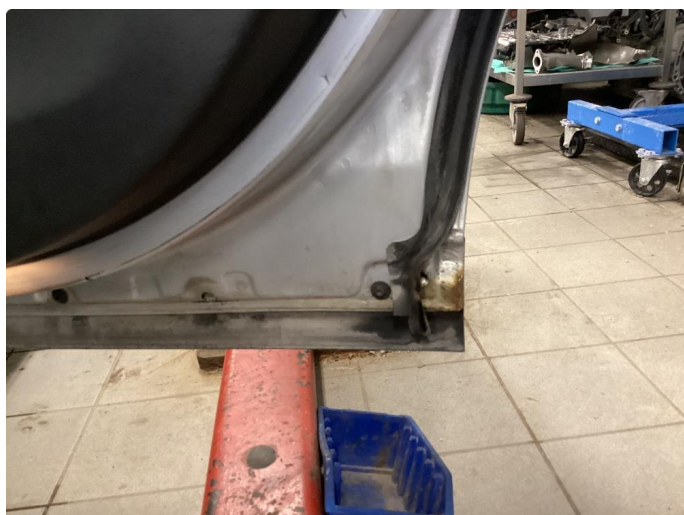
1.3 Rust i fals