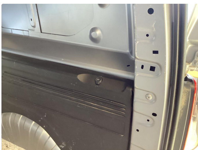
2.1 Riper døråpning