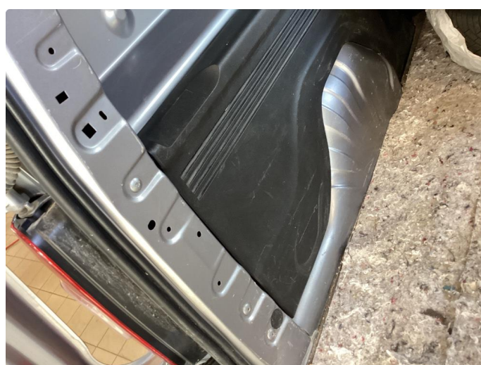
2.1 Riper døråpning