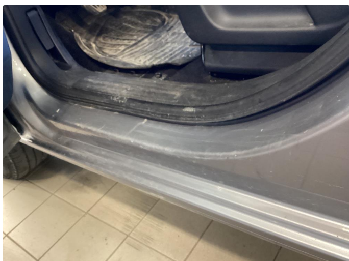
1.3 Noen riper og småbulker