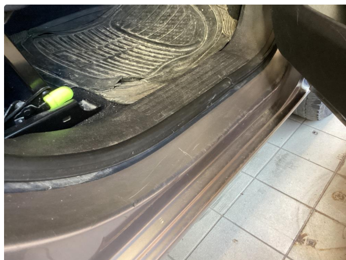
1.3 Noen riper og småbulker