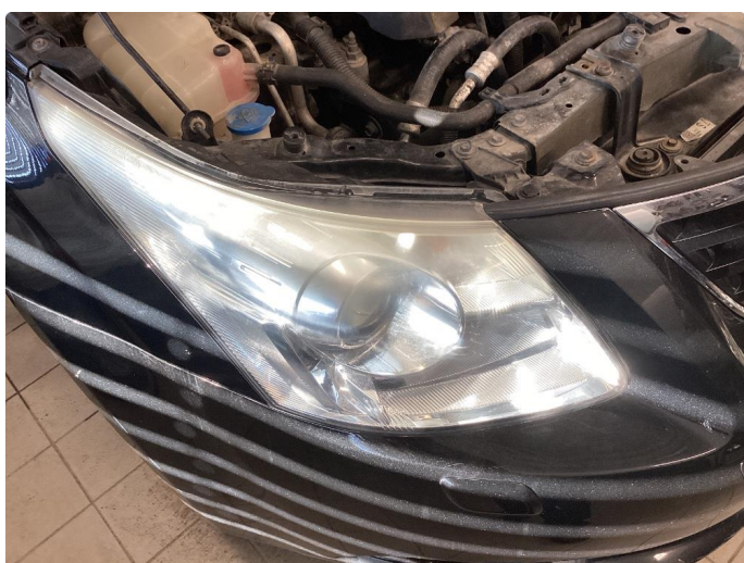
2.1 Matte glass