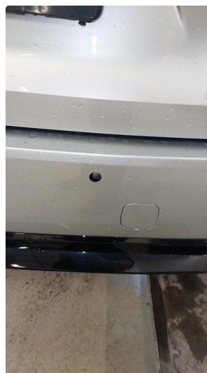
1.3 Øvrige feil