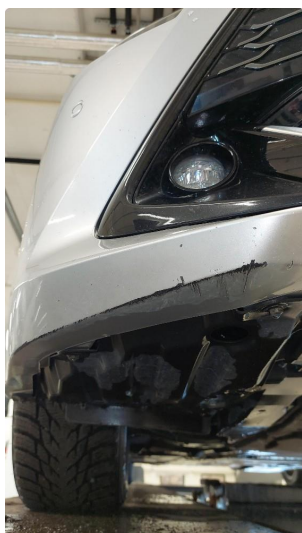
1.2 Skrubbskader underkant