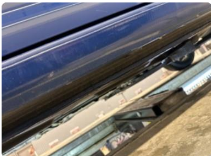
1.3 Bulk kanal venstre.