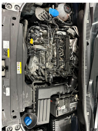
2.1 Motordeksel og bunnplate mangler.