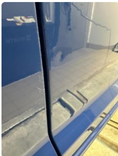
1.1 Liten bulk framkant skjerm venstre bak.