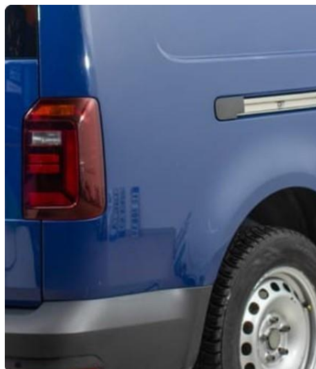
1.2 Liten bulk hjørne bakskjerm høyre.