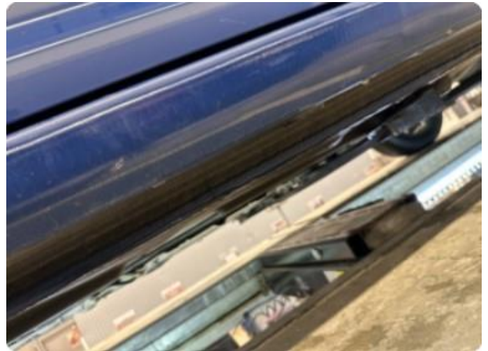
1.2 Bulk kanal venstre.