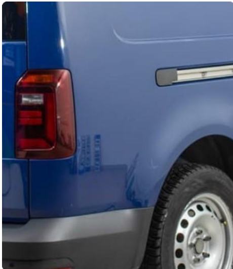
1.1 Liten bulk hjørne bakskjerm høyre.