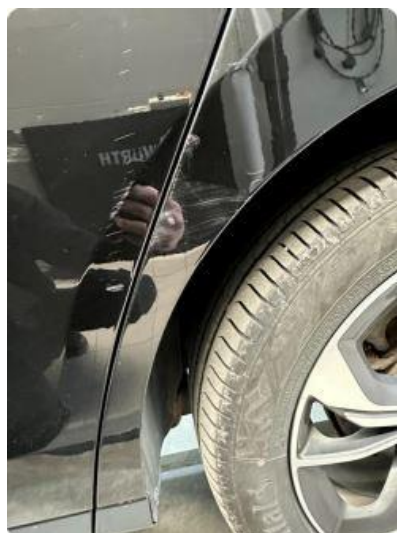
1.2 Riper dør og skjerm venstre bak.