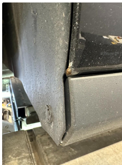
1.3 Lakkskade etter steinsprang. Nedre del hjulbuer foran.