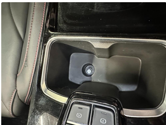
3.1 Deksel mangler. Bunnen av koppholder.