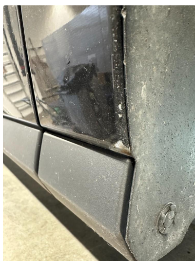
1.3 Lakkskade etter steinsprang. Nedre del hjulbuer foran.