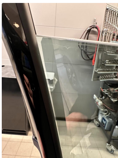
1.7 Solfilm sideruter foran.