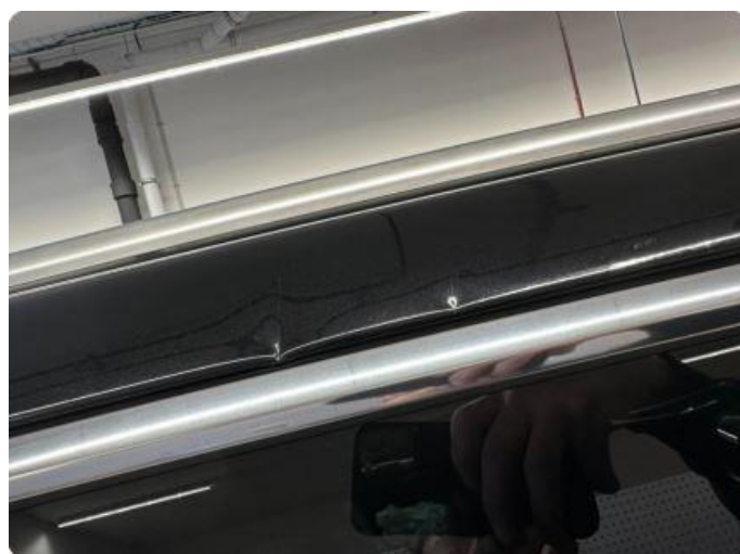
1.8 2 bulker over høyre bakdør.