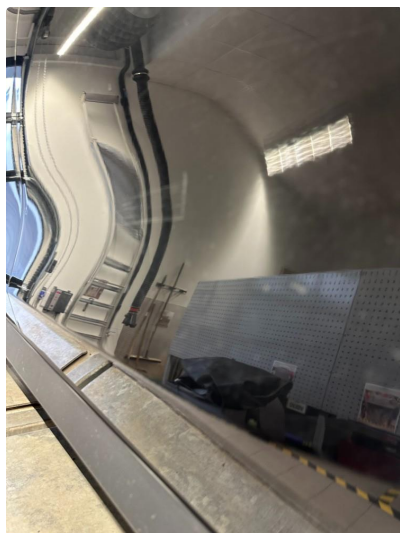
1.1 2 små bulker nedre del dør høyre foran.