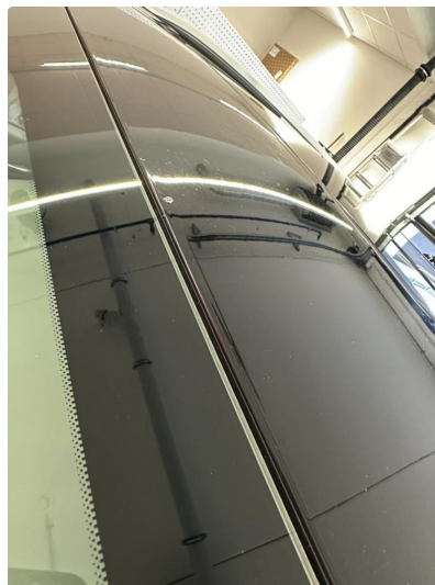
1.6 Steinsprut framkant tak.