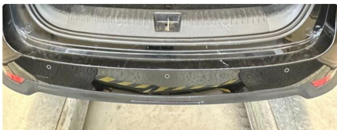
1.5 Riper støtfanger bak.