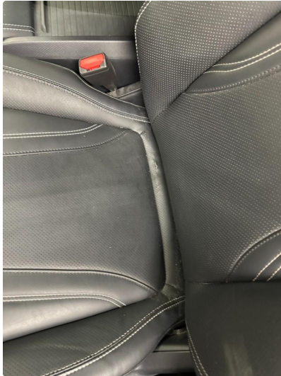
2.1 Skade på setepute fører sete.