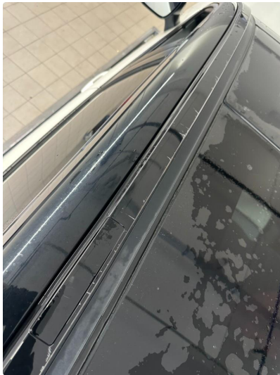
1.3 Riper rails venstre