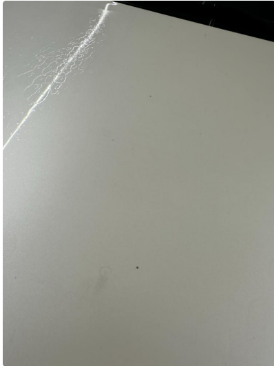
1.1 Små steinsprut panser.