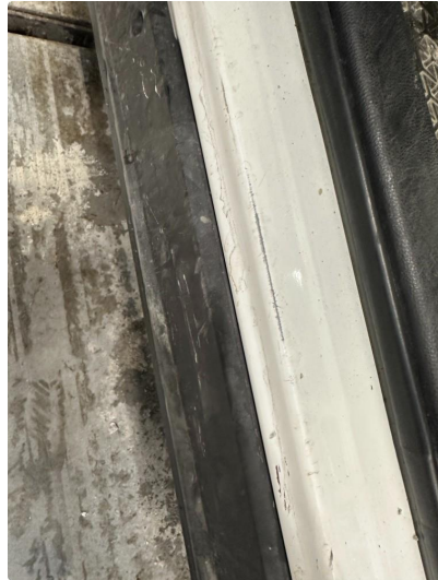
1.2 Slitt lakk innstegssone førerdør.