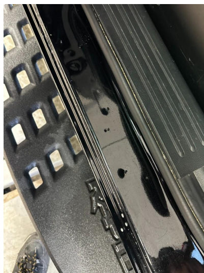
1.2 Bulker døråpninger bak.