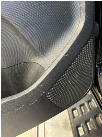
2.1 Riper dørtrekk venstre bak.