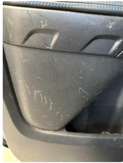
2.1 Riper dørtrekk venstre bak.