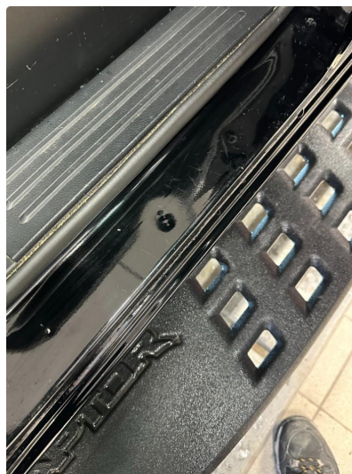
1.2 Bulker døråpninger bak.