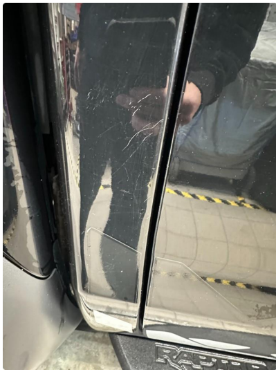
1.4 Riper C-stolpe høyre.