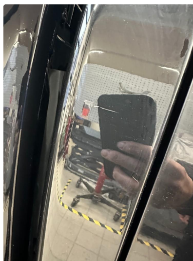
1.4 Riper C-stolpe høyre.