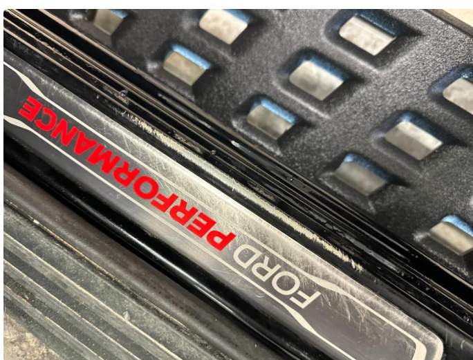
1.3 Slitt lakk døråpning høyre foran.