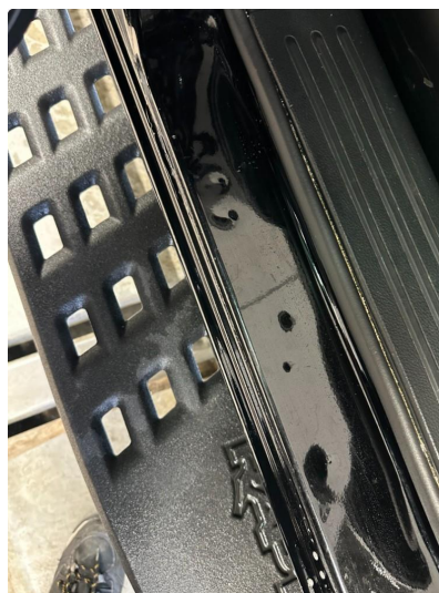
1.2 Bulker døråpninger bak.